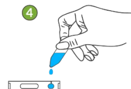
Añada 80µl ( 2 gotas) de buffer sobre el pocillo del test , y lea los resultados pasados 10-15 minutos