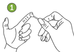
Limpie la zona con alcohol y deje secar